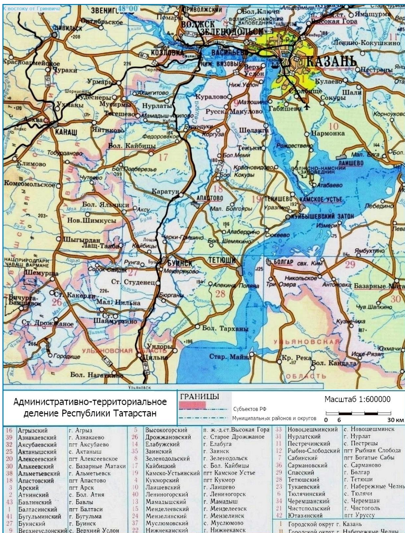
Рис. 1. Район работ по объекту: «Строительство центра стрельбы из лука в г.Казани» в городском округе Казань Республики Татарстан (№ I).