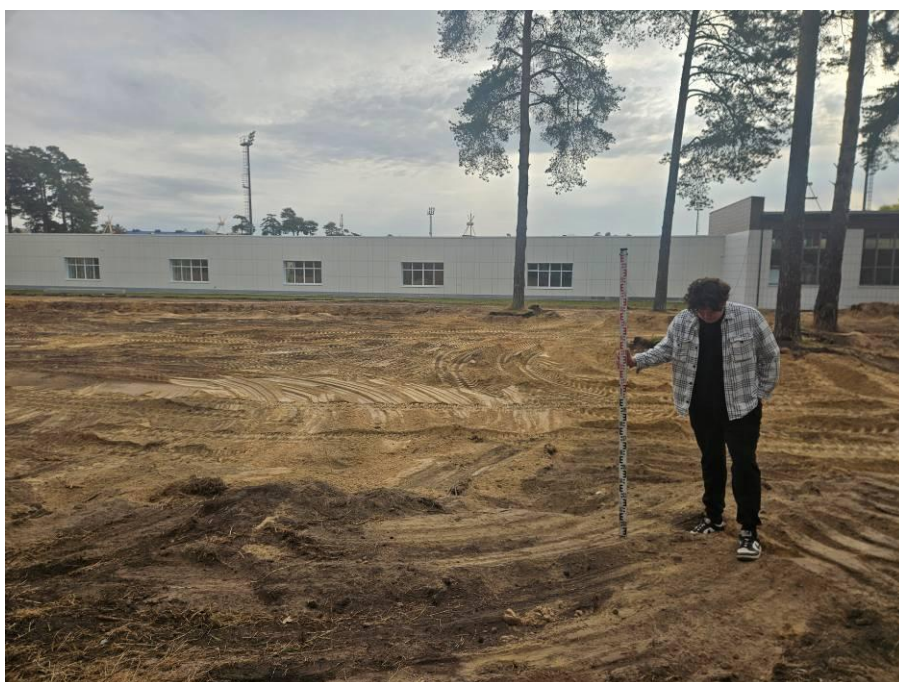
Рис. 7. Типичный ландшафт территории проведения исследований. Общий вид с северо-запада на район расположения южной части земельного участка проектируемого объекта: «Строительство центра стрельбы из лука в г.Казани». Точка фотофиксации №2.