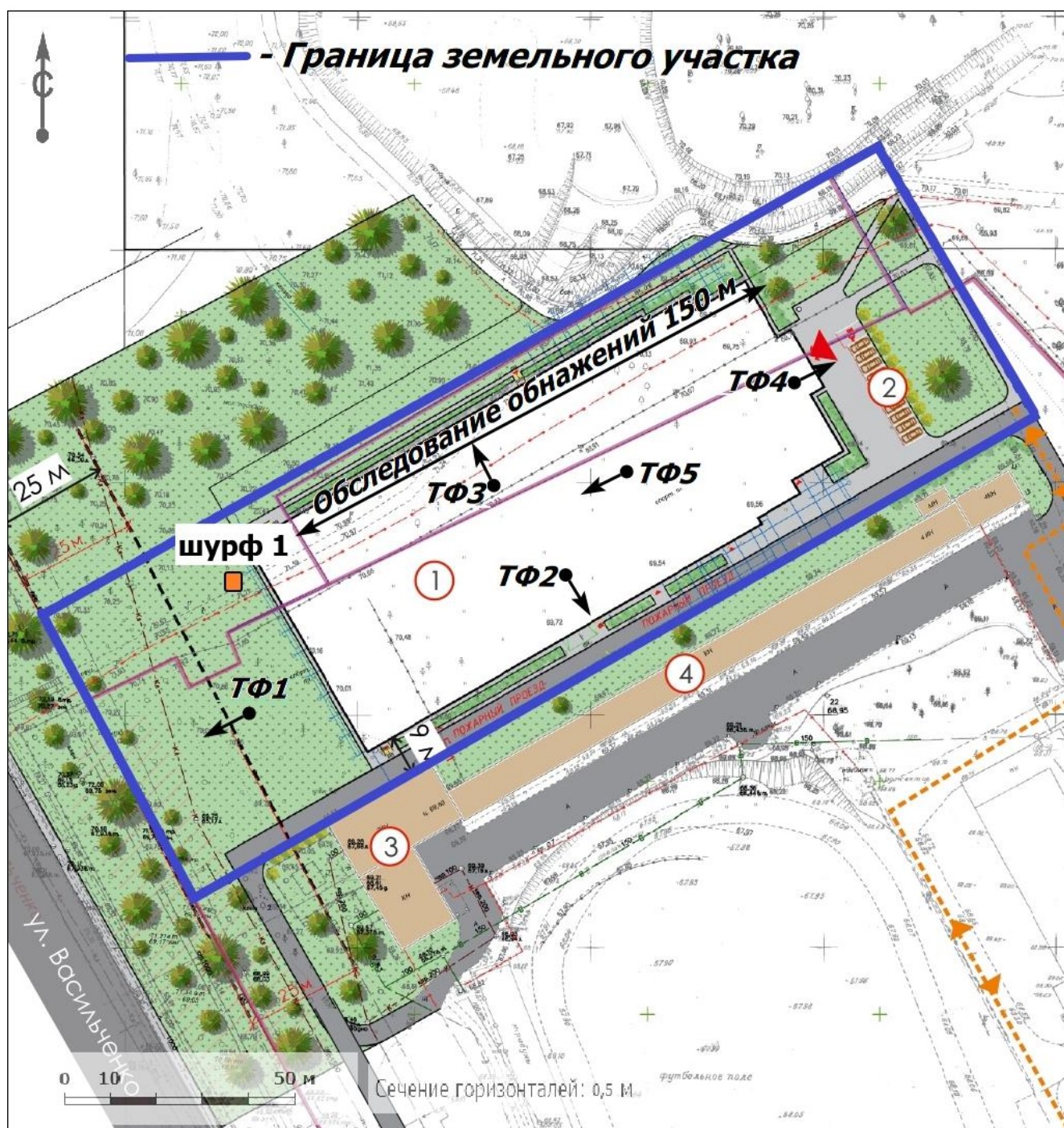
Рис. 5. Участок проектируемого объекта: «Строительство центра стрельбы из лука в г.Казани», расположение мест осмотра обнажений, разведочного разреза и точек фотофиксации.