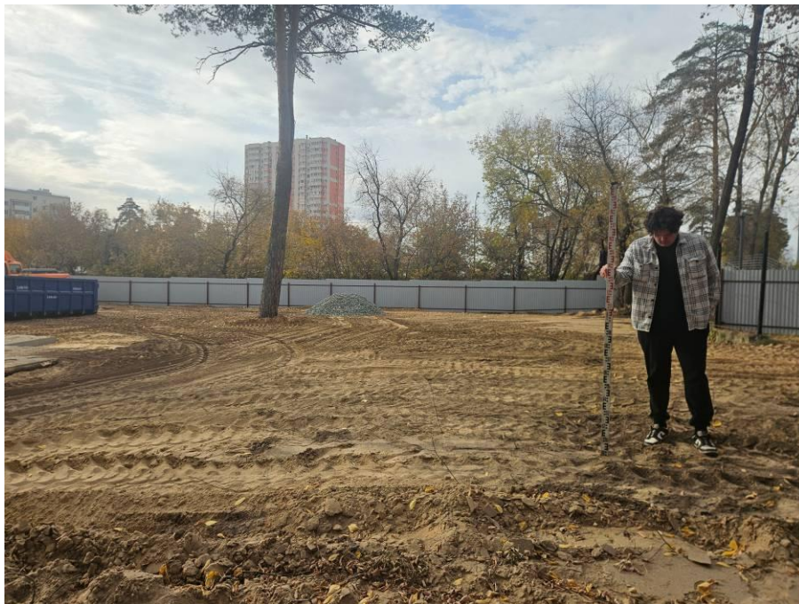
Рис. 6. Типичный ландшафт территории проведения исследований. Общий вид с северо-востока на район расположения юго-западной части земельного участка проектируемого объекта: «Строительство центра стрельбы из лука в г.Казани». Точка фотофиксации №1.