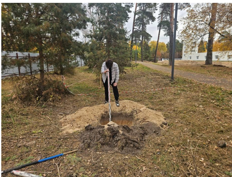
Рис. 13. Шурф № 1. По завершении работ.