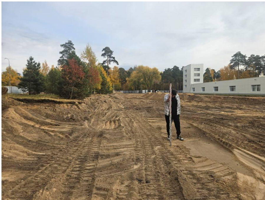
Рис. 9. Типичный ландшафт территории проведения исследований. Общий вид с юго-запада на район расположения северо-восточной части земельного участка проектируемого объекта: «Строительство центра стрельбы из лука в г.Казани». Точка фотофиксации №4.