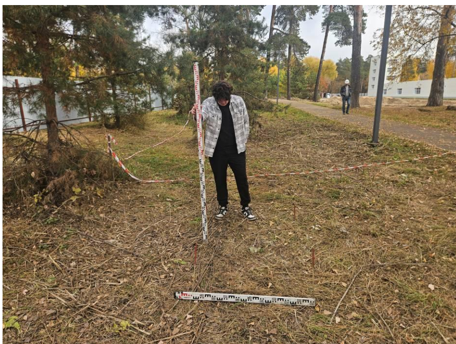
Рис. 11. Шурф № 1. Место заложения и район северо-западной части земельного участка проектируемого объекта: «Строительство центра стрельбы из лука в г.Казани», на задернованной водораздельной поверхности. Вид с юга.