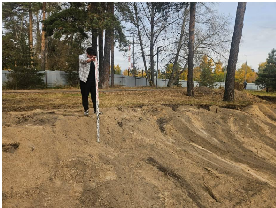
Рис. 8. Осмотр обнажений в районе расположения северной части земельного участка проектируемого объекта: «Строительство центра стрельбы из лука в г.Казани». Общий вид с юго-востока. Точка фотофиксации №3.