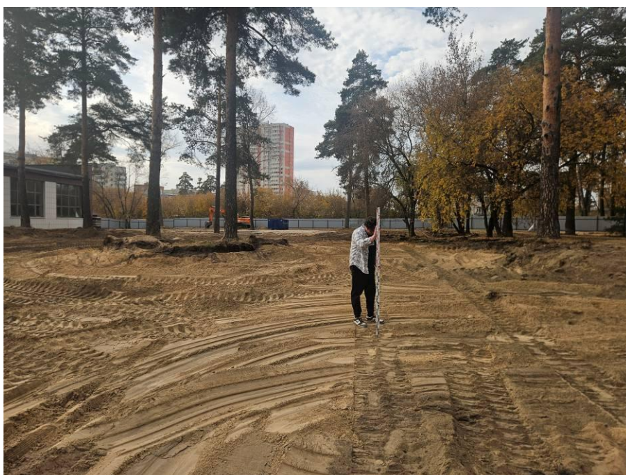
Рис. 10. Типичный ландшафт территории проведения исследований. Общий вид с северо-востока на район расположения центральной части земельного участка проектируемого объекта: «Строительство центра стрельбы из лука в г.Казани». Точка фотофиксации №5.