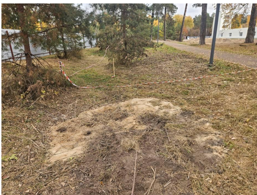
Рис. 14. Шурф № 1. После рекультивации.