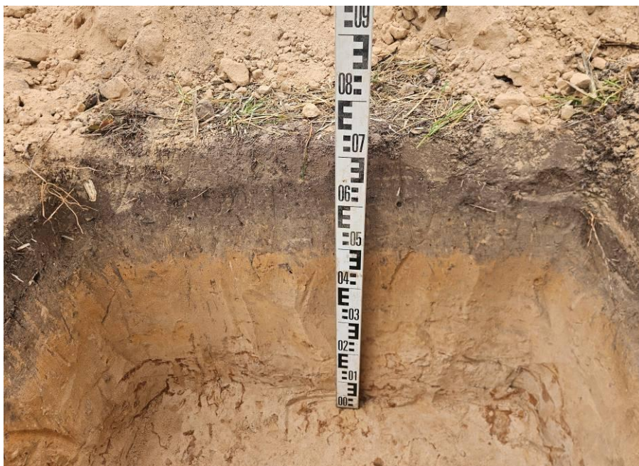
Рис. 12. Шурф № 1. Северная стенка и поверхность материка.